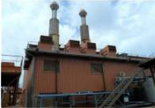
Centrale de Kamsar

PRODUCTION ET DISTRIBUTION COURANT ELECRQUE CBG ANNEE 2023.