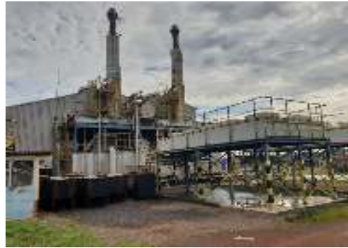
Centrale de Sangarédi