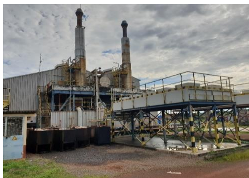
Centrale de Sangarédi