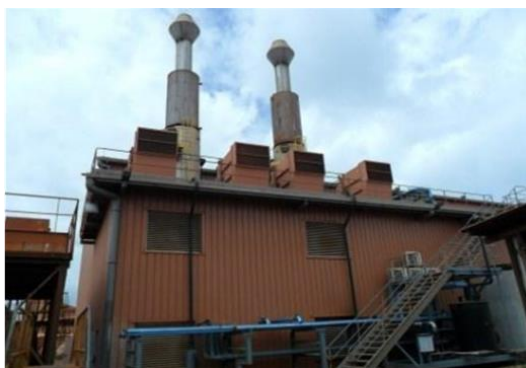
Centrale de Kamsar

PRODUCTION ET DISTRIBUTION COURANT ELECRQUE CBG ANNEE 2022.